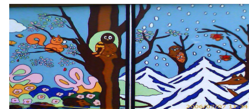
Fresque réalisée par l'école de Beautiran

LIONS CLUB DU SAUTERNES Office du Tourisme 33210 SAUTERNES